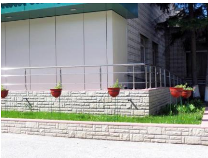
2. Входа (входов) в здание